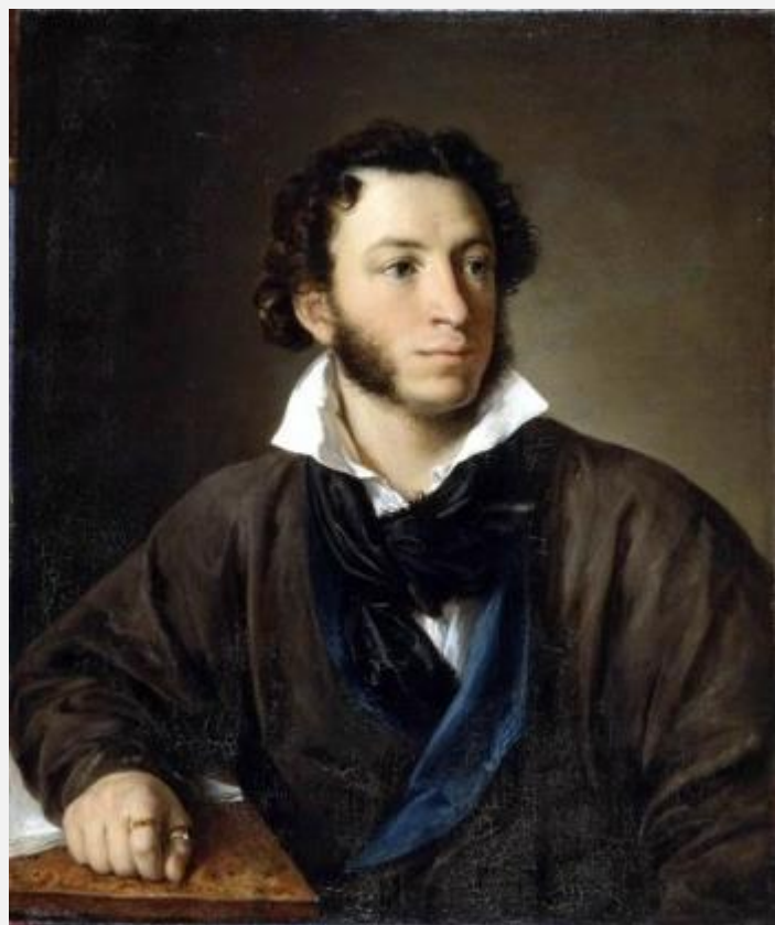
В. А. Тропинин. Пушкин Александр Сергеевич