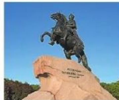
Э. М. Фальконе. «Медный всадник»

Движенья быстры. Он прекрасен. Он весь, как божия гроза. Идёт. Ему коня подводят. Ретив и смирен верный конь.